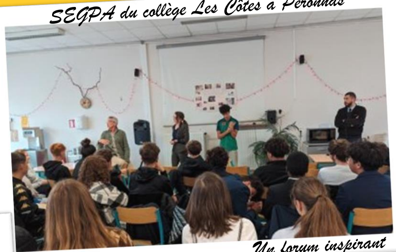
SEGPA du collège Les Côtes à Peronnas