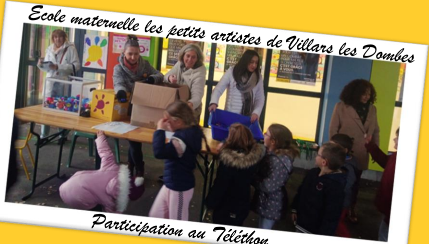
Ecole maternelle les petits artistes de Villars les Dombes