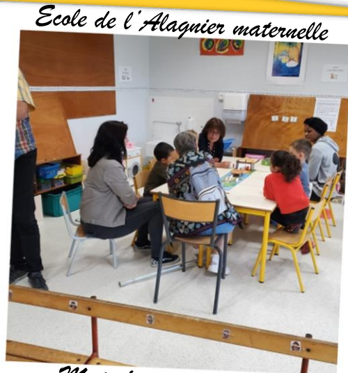
Ecole de l'Alagnier maternelle