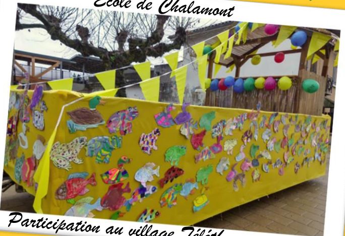
Ecole de Chalamont