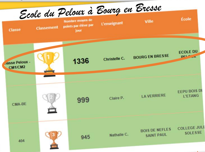
Ecole du Peloux à Bourg en Bresse