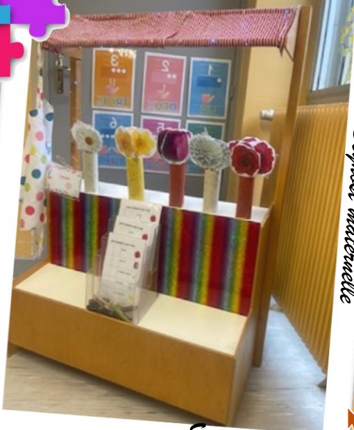
Ecole de Beynost maternelle